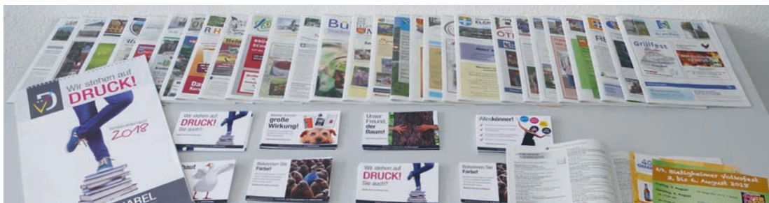
29 Amts- und Mitteilungsblätter können jetzt automatisch mit verschiedensten Beilagen versehen werden.

Kern www.kerngmbh.de Elbe-Leasing www.elbe-leasing.de